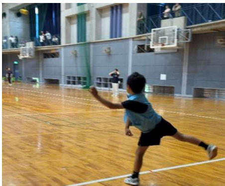
【ソフトボール投げ】