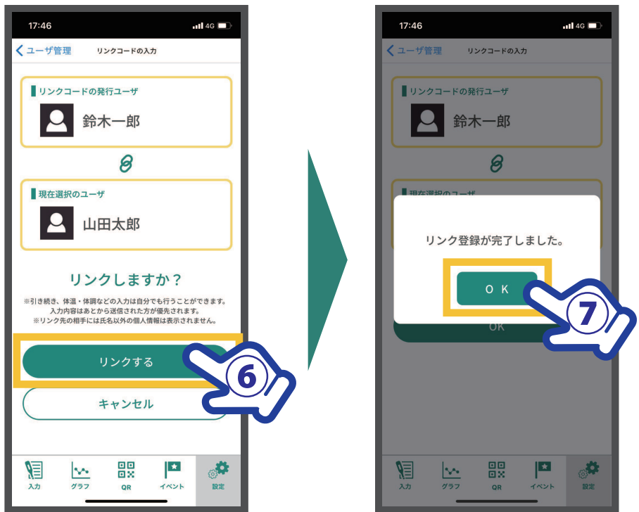
⑥【リンクする】をタップ