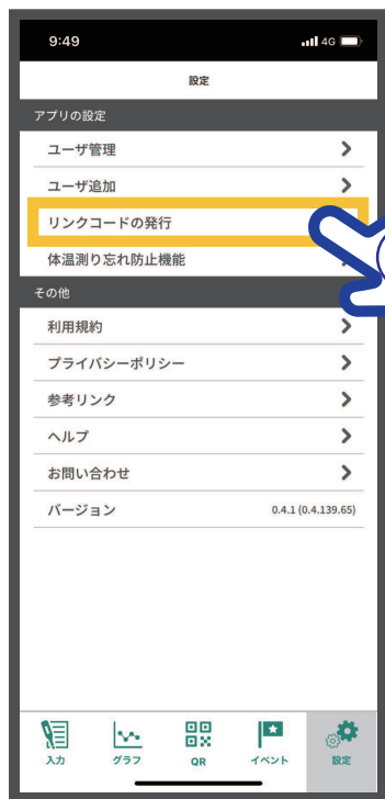
②【リンクコードの発行】をタップ