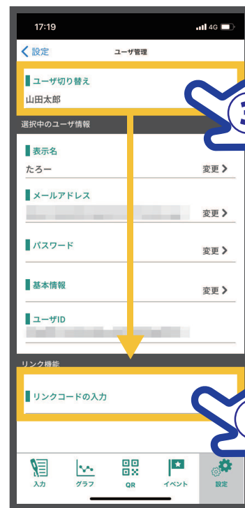
③ 複数のユーザがいる場合【ユーザ切り替え】でリンクするユーザを選択 ④【リンクコードを発行する】をタップ