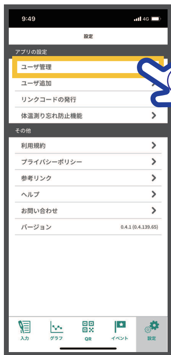
②【ユーザ管理】をタップ