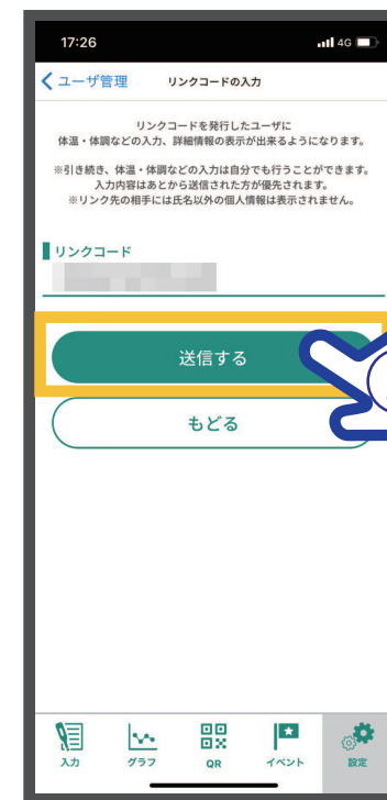
⑤ リンク相手から送付されたリンクコードを入力し【送信する】をタップ