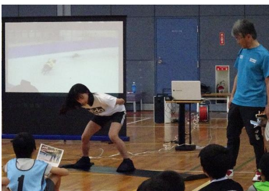
←スピードスケート

これをきっかけに、今回合格となった人も、残念ながらそうでなかった人も、いろいろなスポーツへの挑戦をしてみてくださいと思います。新たな発見をしたり、隠れた才能を見つけたりすることができるかもしれません。