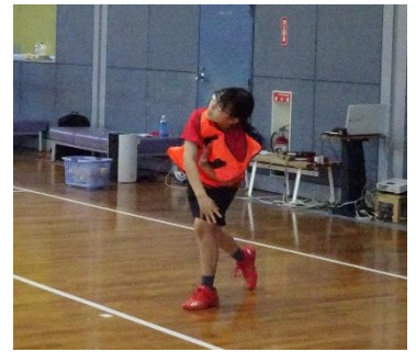
【ソフトボール投げ】